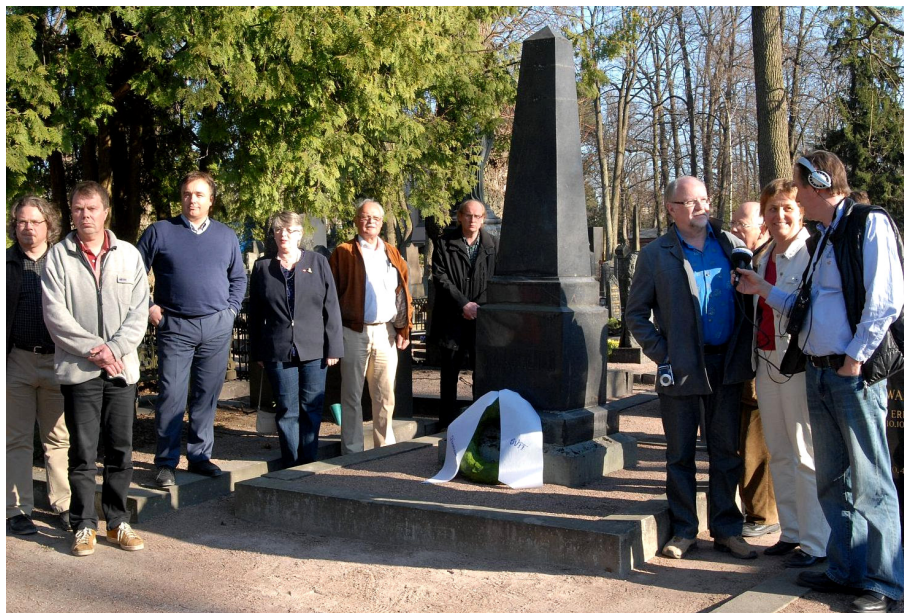
Gottlunds grav på Lappvikens begravningsplats 24.4.2009