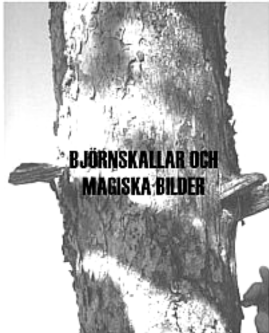
- Skogsfinsk religion och folktrö i materiella källor

Ida Feltzin Vt 2009 Handledare: Mats Mogren